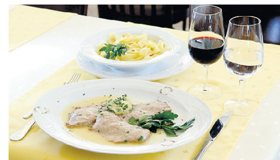
«Gluschtige» Kalbsschnitzel an Zitronensauce.

ria das Ristorante Riethof in Zollikon. Als ihm dort aber der Platz fehlte, beschloss er ein weiteres, grösseres Restaurant zu eröffnen. So kam er letztes Jahr nach Meilen und übernahm das Restaurant Bahnhof. Mit viel Elan liess er die alte, dunkle «Beiz» in eine kleine, helle Little-Italy-Oase mit Bar, Raucher- und Nichtraucherbereich umgestalten. Für Firmenanlässe, Geburtstagspartys und Bankette steht auch ein Konferenzraum für bis zu 20 Personen zur Verfügung.