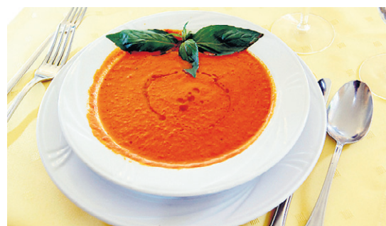
Spezialität des Hauses: Tomatencremesuppe